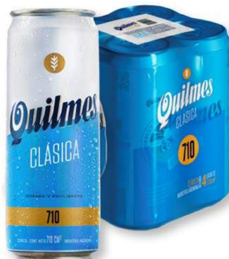
Cerveza "Quilmes" Clásica Pack x 4 Latas de 710 cc. c/u (1) *1.000