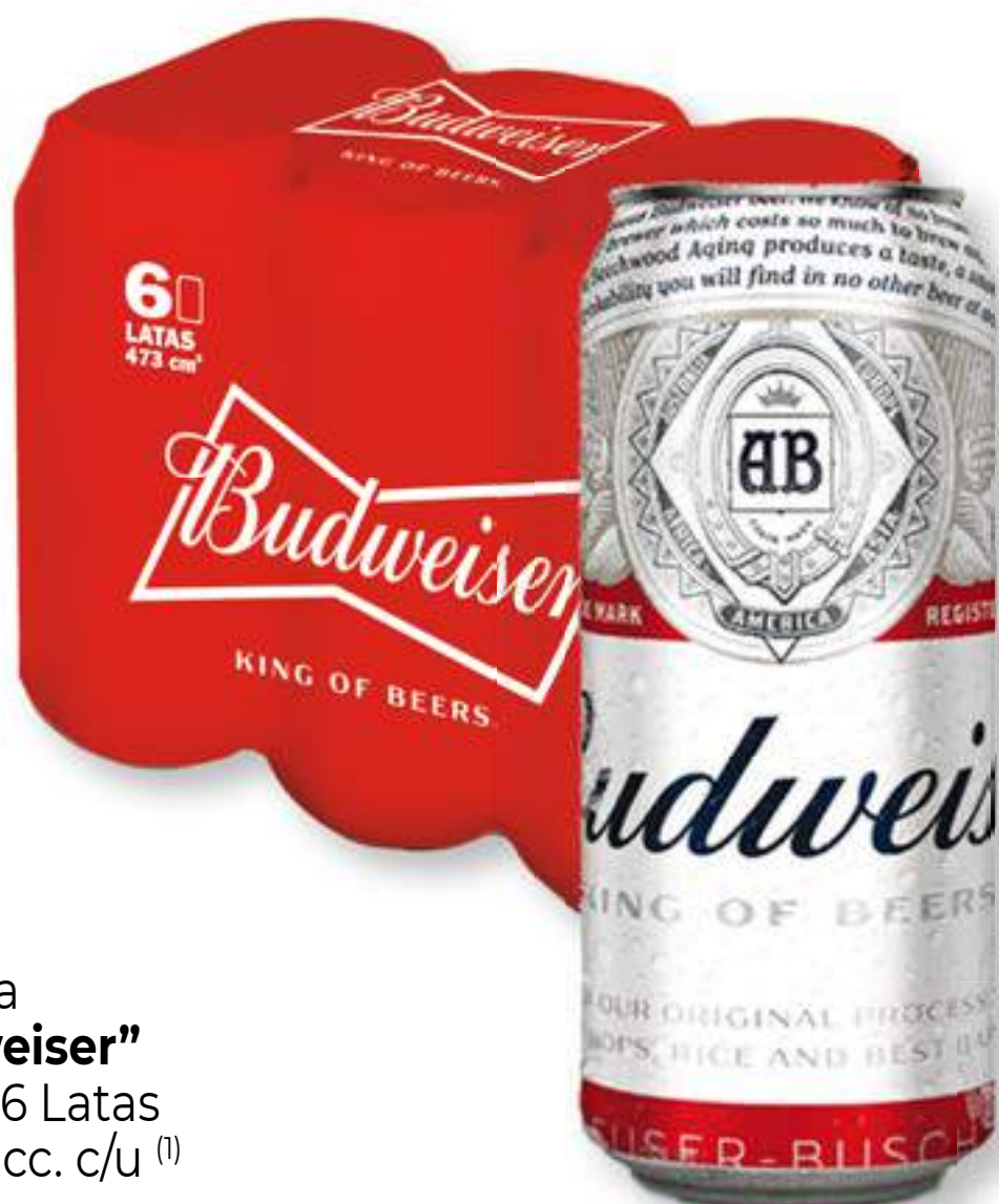
Cerveza "Budweiser" Pack x 6 Latas de 473 cc. c/u (1) *1.000