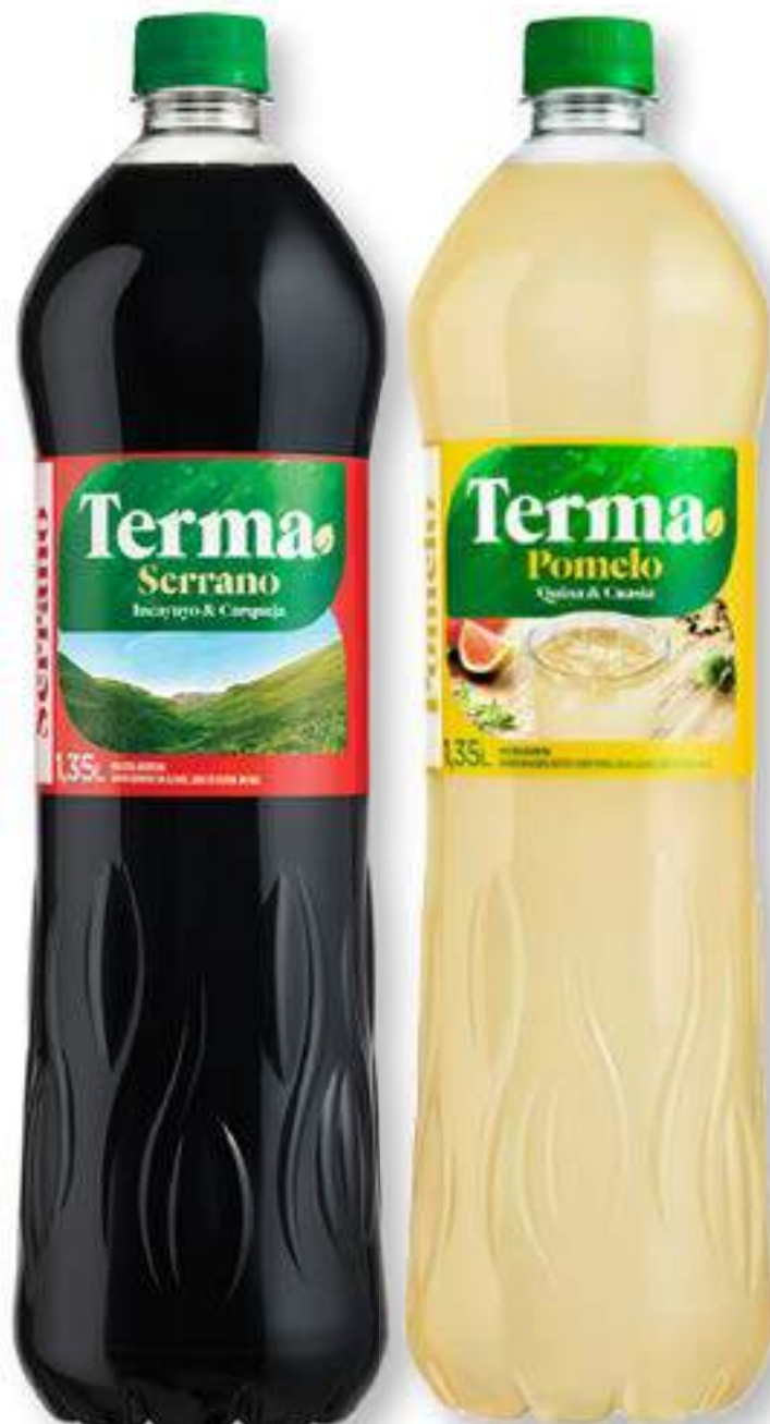
Amargo "Terma" Regular/ Cero Todos los Sabores Pet x 1,35 lt. c/u *1.000

Precio Normal $2.850 Precio x Lt. $2.111 11 PRECIO SIN IMPUESTOS NACIONALES $2.355 37