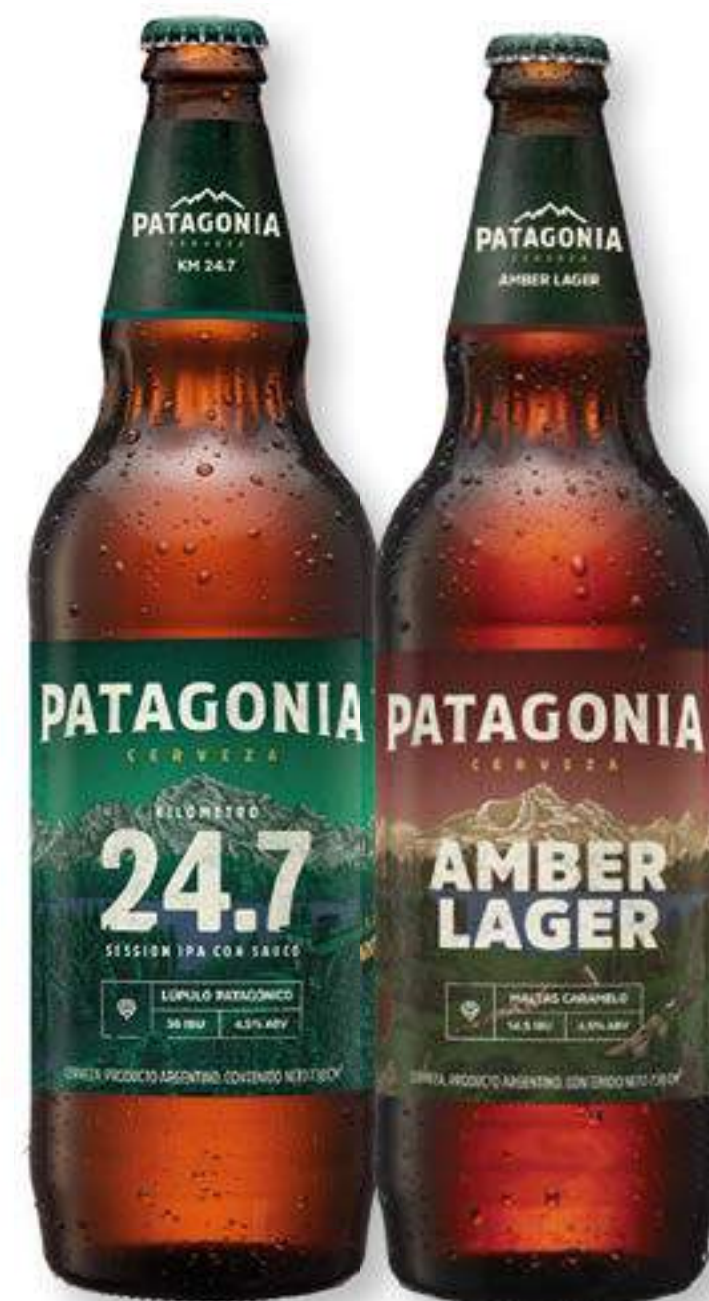
Cerveza sin Retorno "Patagonia" KM 24,7/ Amber Lager/ Lager del Sur/ Vera Ipa x 730 cc. c/u (1) *1.000