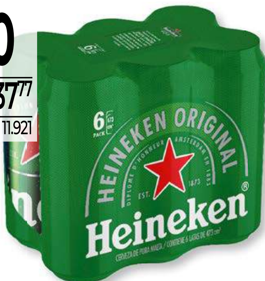
Cerveza "Heineken" Pack x 6 Latas de 473 cc. c/u (1) *1.000

Precio x Lt. $5.637 77 PRECIO SIN IMPUESTOS NACIONALES $11.921